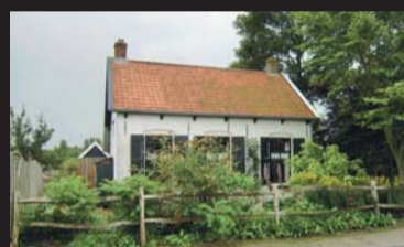
Hananweg 13 NOORDGOUWE € 259.000,-- k.k.