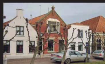
Ring 20 DREISCHOR € 272.500,-- k.k.