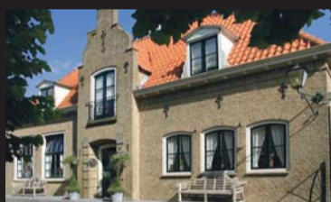
Ring 32 DREISCHOR € 449.000,-- k.k.