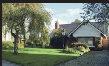
Molenweg 22 OOSTERLAND € 385.000,-- k.k.