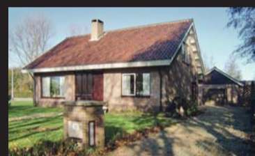
Heereweg 10 NOORDGOUWE € 445.000,-- k.k.