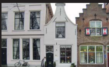
Oude Haven 24 ZIERIKZEE € 229.000,-- k.k.