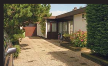
Grevelingenlaan 31 SCHARENDIJKE € 219.000,-- k.k.