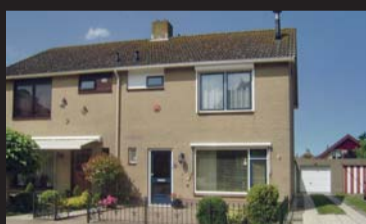
Kamillestraat 6 SCHARENDIJKE € 248.500,-- k.k.