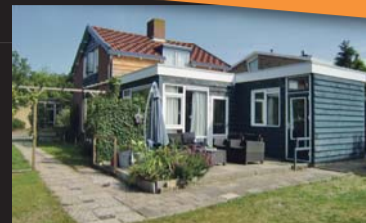
Julianastraat 15 BURGH-HAAMSTEDE € 274.000,-- k.k.