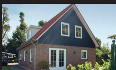
Hoogenboomlaan 44-93 RENESE € 259.000,-- k.k.