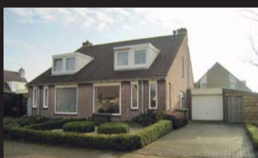
Klaverstraat 36 SCHARENDIJKE € 259.000,-- k.k.