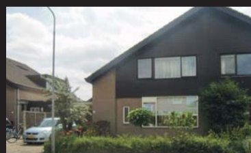
Vlakestraat 39 ZIERIKZEE € 274.500,-- k.k.