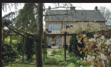
Mulockstraat 31 ZIERIKZEE € 199.000,-- k.k.