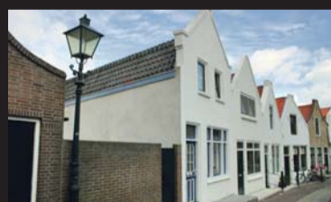
Kappellestraat 16 ZIERIKZEE € 149.000,-- k.k.