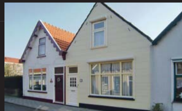
Molenstraat 4 BRUINISSE € 169.000,-- k.k.