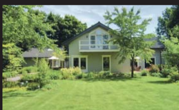
Essebos 3 NOORDGOUWE € 825.000,-- k.k.