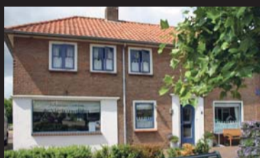
Groenendaal 3 OOSTERLAND PRIJS OP AANVRAAG