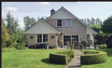
Grevelingenhout 176 BRUINISSE € 449.000,-- k.k.