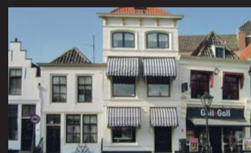
Kraanplein 4 ZIERIKZEE € 375.000,-- k.k.