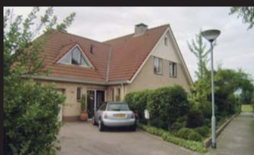
Tuin 19 OOSTERLAND € 475.000,-- k.k.

Wie tussen 1 februari en 30 april 2012 overeenstemming bereikt over de aankoop van de woning, ontvangt een korting van € 2.012,-- op de kosten van overdracht . Dit bedrag komt bovenop de aantrekkelijke verlaging van de overdrachtsbelasting van 6% naar 2%. (Let op: de verlaging van de overdrachtbelasting geldt tot 1 juli 2012!)