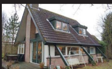
Oostweg 2-122 OUWERKERK € 199.000,-- k.k.

Wie tussen 1 februari en 30 april 2012 overeenstemming bereikt over de aankoop van de woning, ontvangt een korting van € 2.012,-- op de kosten van overdracht . Dit bedrag komt bovenop de aantrekkelijke verlaging van de overdrachtsbelasting van 6% naar 2%. (Let op: de verlaging van de overdrachtbelasting geldt tot 1 juli 2012!)