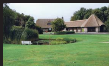
Meeldijk 1 BURGH-HAAMSTEDE € 1.090.000,-- k.k.

De verkopers van Estio makelaars geven een koper nog meer redenen om in 2012 juist wél een woning te kopen! Bij aankoop in de maanden februari, maart en april van één van de deelnemende panden, krijgt de koper een extra korting . Deze aantrekkelijke korting maakt de aankoop van een woning nog interessanter!