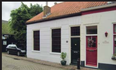
Molenstraat 35 BROUWERSHAVEN € 249.000,-- k.k.