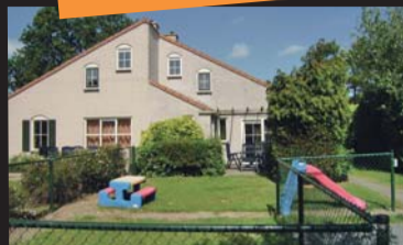
Christoffellaan 13 BROUWERSHAVEN € 145.000,-- k.k.