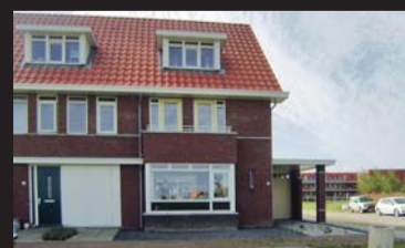
Watergang 34 ZIERIKZEE € 335.000,-- k.k.