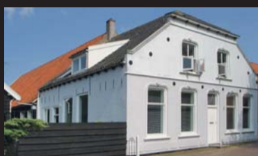
Slotstraat 19 DREISCHOR € 650.000,-- k.k.