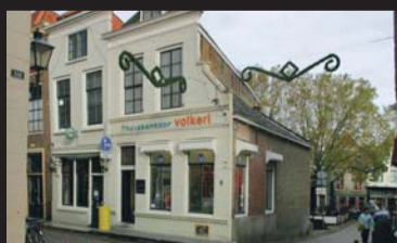
Melkmarkt 2 ZIERIKZEE € 445.000,-- k.k.