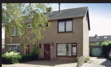
Kamillestraat 19 SCHARENDIJKE € 195.000,-- k.k.