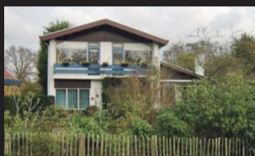
Kloosterweg 28 BURGH-HAAMSTEDE € 549.000,-- k.k.

De verkopers van Estio makelaars geven een koper nog meer redenen om in 2012 juist wél een woning te kopen! Bij aankoop in de maanden februari, maart en april van één van de deelnemende panden, krijgt de koper een extra korting . Deze aantrekkelijke korting maakt de aankoop van een woning nog interessanter!