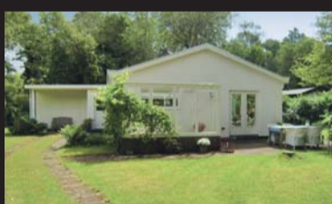
Lijsterweg 30 RENESE € 389.000,-- k.k.